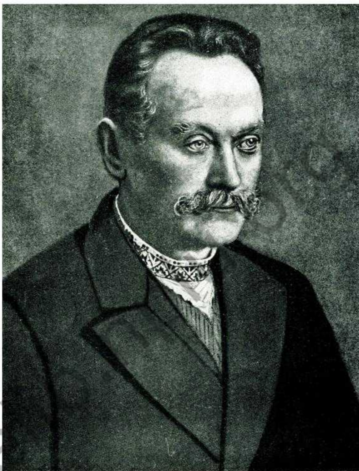
ІВАН ФРАНКО 1856 — 1916