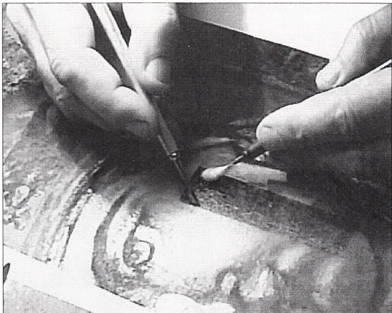
Реставратор над іконою.

Холмська Чудотворна ікона Богородиці є однією з найвідоміших і найшанованіших у православному світі. Вона має славу і водночас трагічну історію, що тісно переплелася з історією українського народу.