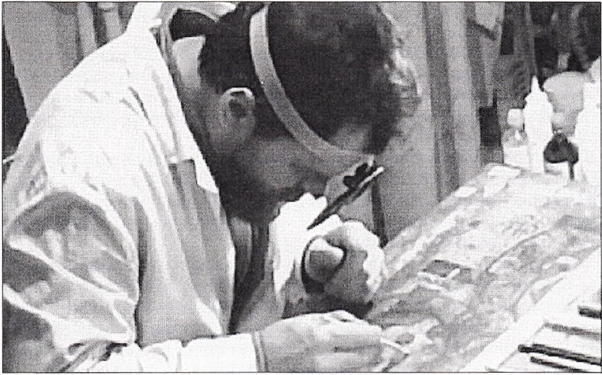
Реставратор над іконою.

двох поручів та пластини круглої форми. На зап'ясті правої руки кріпиться один прямокутний поруч. Ці прикраси виконані технікою перегородчастої емалі періоду Візантії та Київської Русі IX-XII століття: на прямокутних пластинах геометризований рослинний орнамент, на круглій пластині – орнамент у вигляді літери «Т» з двома пташками під перекладами літери. Емаль синя, біла, червона, зелена.