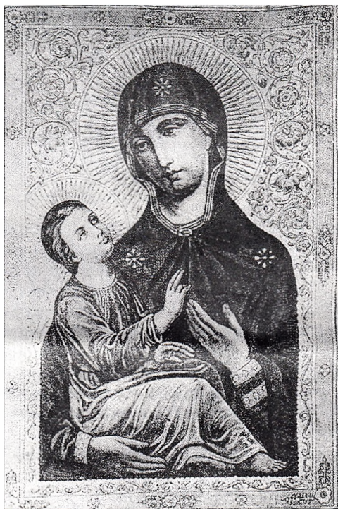
Холмська Чудотворна ікона Богородиці Гравюра XVII століття.