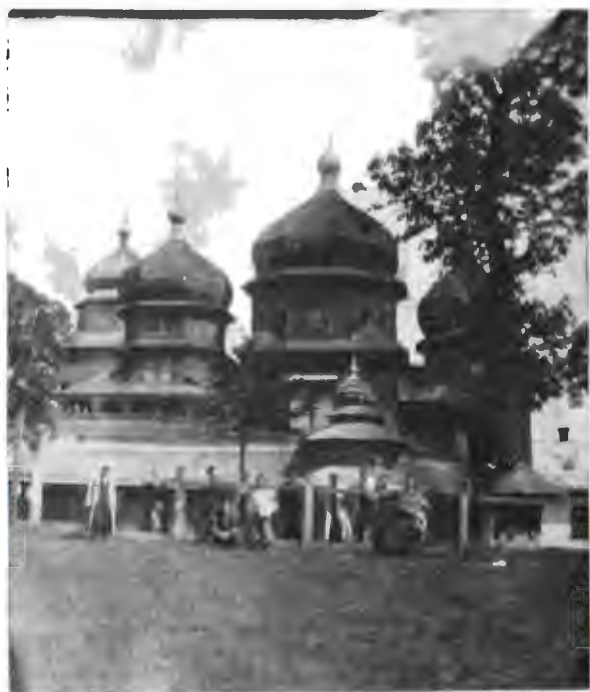
Ліцеїсти під церквою св. Юра. Церква св. Юра в Дрогобичі, яку перевезено з Києва й яка має понад 400 літ. Зроблена без жодного залізного цвяха.

м. Стрий. Тут оглядалася українська гарбарня, де виробляли лише верхній товар хромовим чиненням (т. зв. бокс з телячих шкір). Тримав цю гарбарню місцевий адвокат. Гарбарня була в якійсь stodolі і могла втримуватись лише через малу конкуренцію. Оглядали солідну механічну майстерню залізниць, два поважних вальцевих млини (проми-