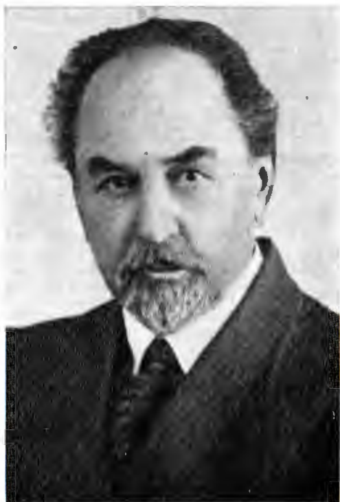
Евген Харлампович Чикаленко