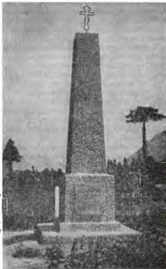
Пам'ятник козакам і їхніх родин, жертв силомісної репатріації, вбитих 1. червня 1945 року на Православному цвинтарі в Лієнцу (Австрія)

На спогад цієї жорстоко-брутальної розправи англійців на православному цвинтарі в Лієнці (Австрія) поставлена висока кам'янна колона з хрестом нагорі з англійським написом, що по-українському звучить: «Пам'ятник козакам і їхнім родинам, жертв силомісної репатріації, вбитих 1. червня 1945 року на Православному цвинтарі в Лієнцу (Австрія)».