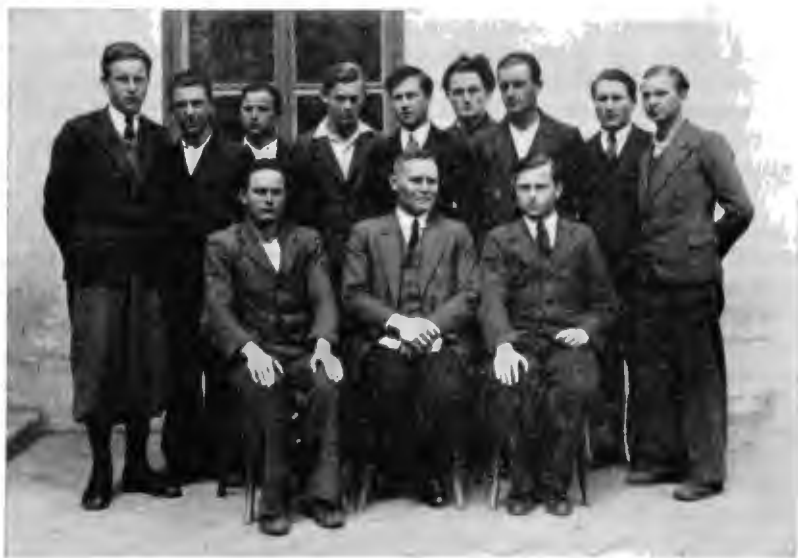
Другий річник ліцеїстів