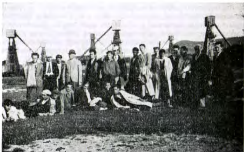
На фоні нафтових веж в Бориславі

ка, другого продуцента мінеральних добрив у Галичині. Ці оглядини також обмежувалися на поверхні, бо в копальню (під землею) адміністрація не впускала. Ночували в селі у заможніших селян, які давали й вечерю, по стодолах. Далі заїздили до Болехова, де оглядали декілька гарбарень, що виробляли, між іншим, імітацію червоної юхти, уживаючи, замість вербової, соснову кору і товщуючи не березовим дьогтем, а комбінованим товщем. Так доїздили до Калуша — гордості Галичини, бо на цілу Польщу постачав потасові гноїва (каїніт тощо). Тут спускалися й під землю в копальні. В Калуші не лишали без уваги і малої, але раціонально устаткованої молочарні Маслосоюзу, ласуючи маслянкою... (сколотиною).