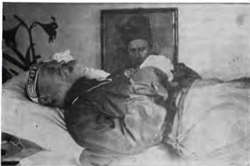
Остання згадка про батька, старого, убитого горем, якого добила дитяча недоля.