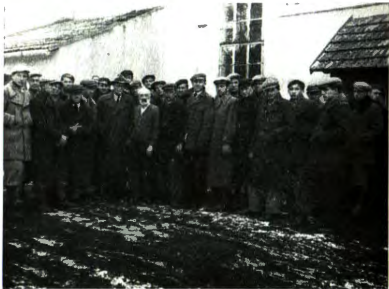
Екскурсія з 3-м і 1-м річниками на гуральню в Рудниках. Без капелюха — керівник гуральні, праворуч нього В. М.

Проводити екскурсії В. М. почав з другого річника, до якого частіше приєднувалися й учні першого річника. З цього типу екскурсій ліцеїсти пшчки відвідали склярню в Пісочній, яка виробляла скло для лямпи, малі пляшки тощо.