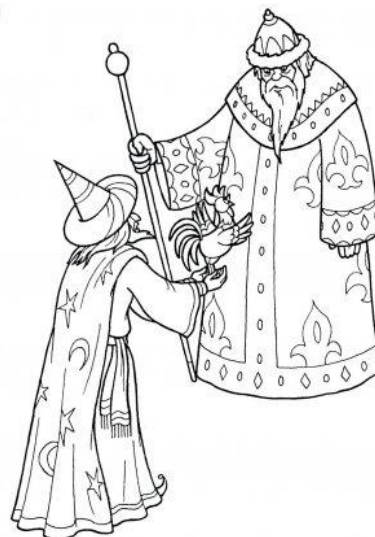
СКАЗКА О ЗОЛОТОМ ПЕТУШКЕ