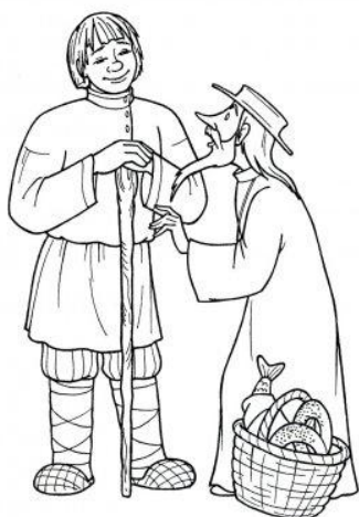
СКАЗКА О ПОПЕ И О РАБОТНИКЕ ЕГО БАЛДЕ