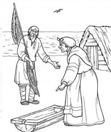
СКАЗКА О РЫБАКЕ И РЫБКЕ