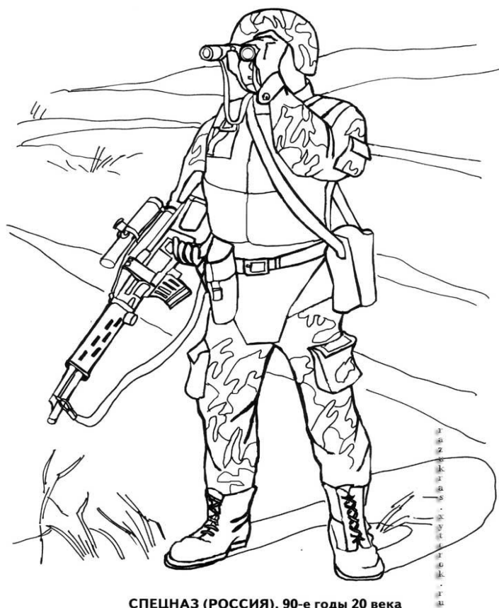
СПЕЦНАЗ (РОССИЯ). 90-е годы 20 века

Ответь на вопрос: Какими качествами должен обладать современный воин – солдат? _____ _____ _____