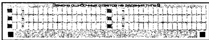
Рис. 10. Область замены ошибочных ответов на задания типа В

В нижней части бланка ответов № 1 предусмотрены поля для записи новых вариантов ответов на задания типа В взамен ошибочно записанных (рис. 10). Максимальное количество таких исправлений — 6 (шесть).